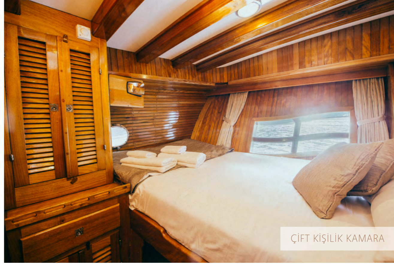
ÇİFT KİŞİLİK KAMARA

Çocuklar ve yetişkinler için can yelekleri yatakların altındadır. Salon, makine dairesi ve mutfakta yangın söndürücüler vardır. Yatın ön koridorunda bir yangın kaçış yolu bulunmaktadır ve ilk yardım çantası da salondadır.