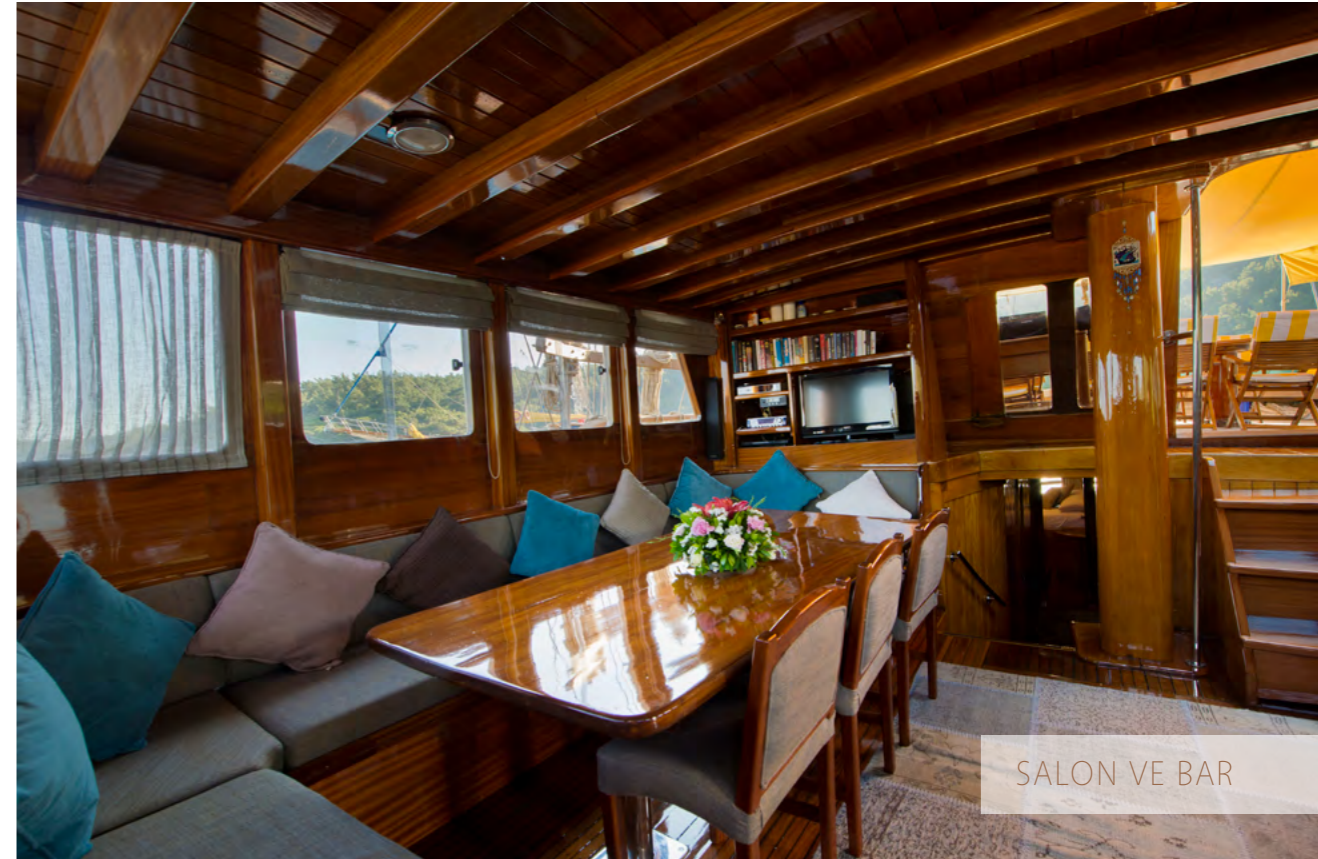
SALON VE BAR