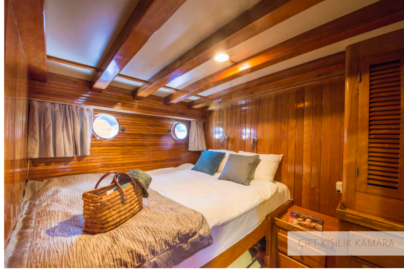
ÇİFT KİŞİLİK KAMARA

Çocuklar ve yetişkinler için can yelekleri yatakların altındadır. Salon, makine dairesi ve mutfakta yangın söndürücüler vardır. Yatın ön koridorunda bir yangın kaçış yolu bulunmaktadır ve ilk yardım çantası da salondadır.