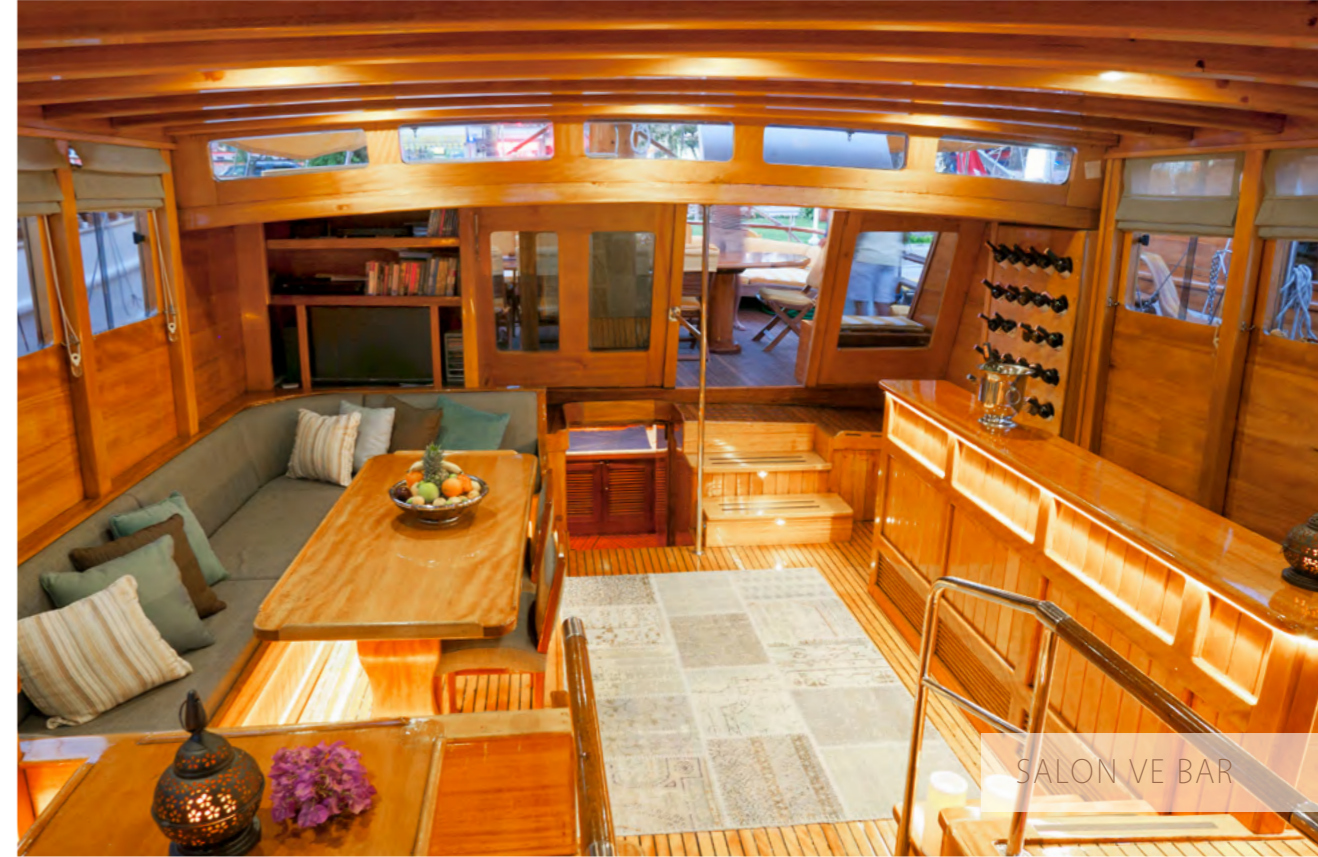
SALON VE BAR