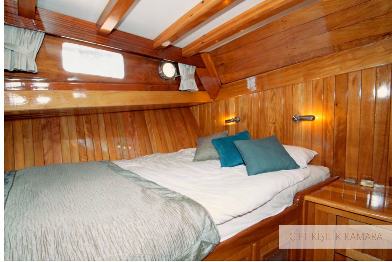
ÇİFT KİŞİLİK KAMARA

Çocuklar ve yetişkinler için can yelekleri yatakların altındadır. Salon, makine dairesi ve mutfakta yangın söndürücüler vardır. Yatın ön koridorunda bir yangın kaçış yolu bulunmaktadır ve ilk yardım çantası da salondadır.