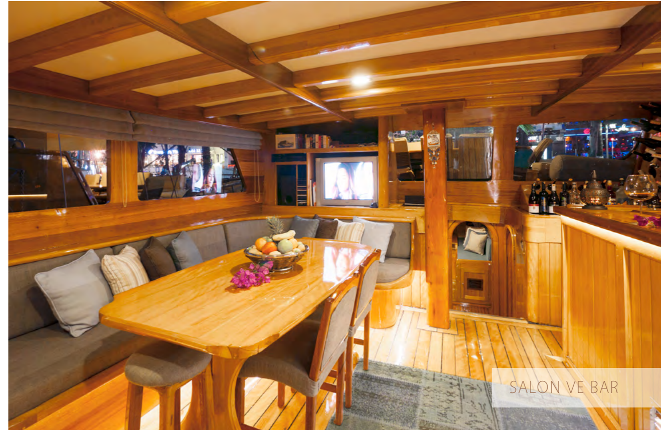
SALON VE BAR